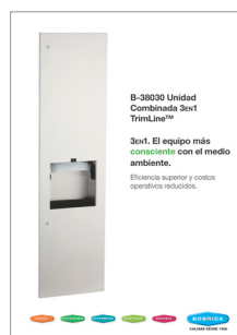
Unidad en combinación B-38030 TrimLine 3 en 1