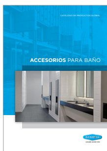
Catálogo de accesorios para el lavatorio

Bobrick se enorgullece en ofrecer productos líderes y experiencia en el diseño. Para un respaldo indispensable en diseño, cumplimiento normativo y logística, comuníquese con su representante de Bobrick o visite bobrick.com .