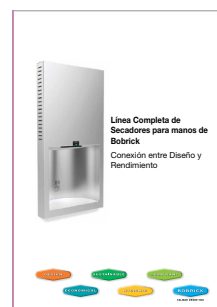
La línea completa de secamanos de Bobrick