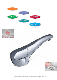
Dispensador automático de jabón líquido SureFlo® B-824