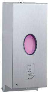
B-2012 Automatischer Seifenspender für Wandmontage 850 ml