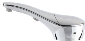
B-824 SureFlo®, Befüllung von oben mit Flüssigseife, 1,0 l

Hygiene Produktlösungen und weitere Informationen unter bobrick.com