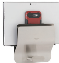
B-635 Klutch Mobil- geräthalterung