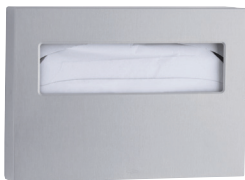
B-221 ClassicSeries® WC-Sitz- Auflagenspender zur Aufputzmontage