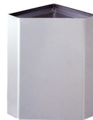
B-268 Eckabfallbehälter zur Aufputzmontage